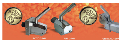
Palniki peletowe Eco-Palnik – dostępne w kilku seriach konstrukcyjnych